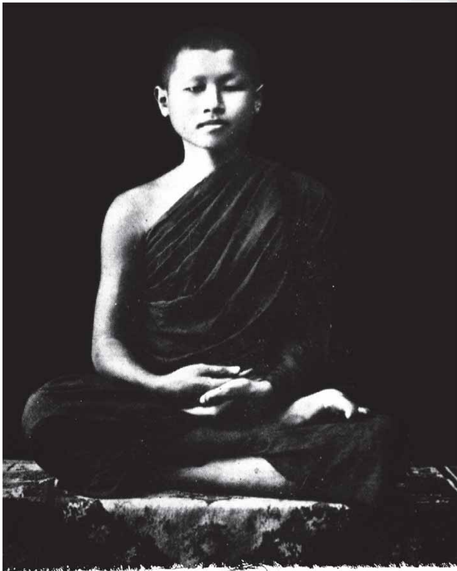
สามเณรประมัย ภาพเนตร (สีลาภิรโต)ป.